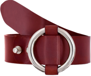
250472 - 35mm - Burgundy/Bourgogne