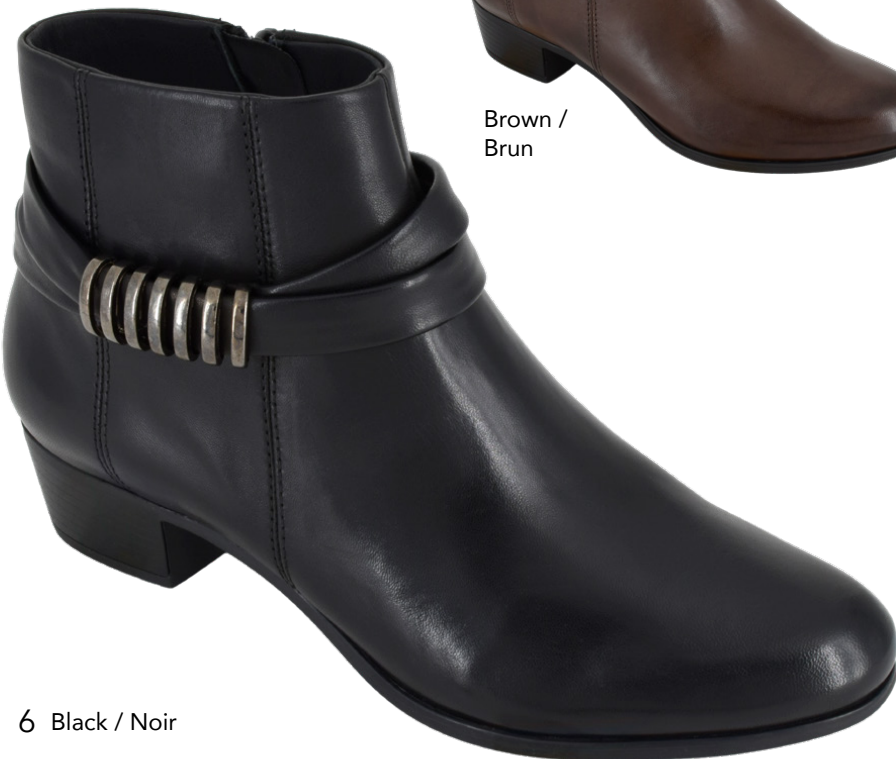
6 Black / Noir

Women's full sizes 36-42 Genuine leather upper Water repellent breathable membrane Cozy brushed fleece lining Shaft height: 4.5" (11.5 cm) Heel height: 1.25" (3.2 cm) Inside zipper Genuine leather full padded insole Lightweight & durable TPR outsole