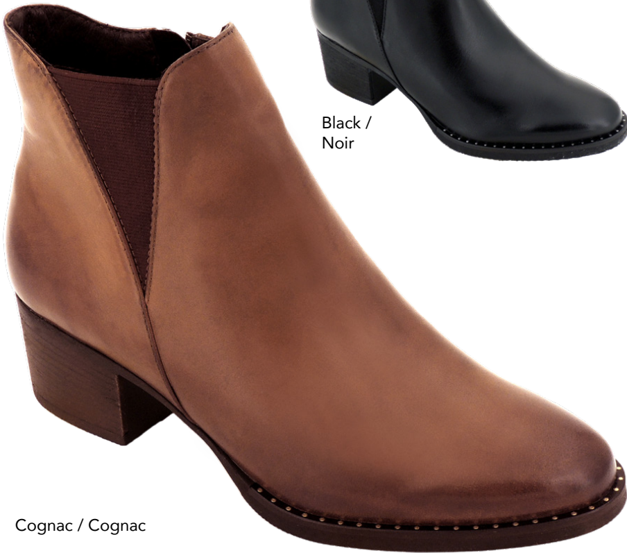
Cognac / Cognac

Women's full sizes 36-42 Genuine leather upper Water repellent breathable membrane Cozy brushed fleece lining Shaft height: 4.25" (11 cm) Heel height: 1.75" (4.4 cm) Easy on single gore Inside zipper Genuine leather full padded insole Lightweight & durable TPR outsole