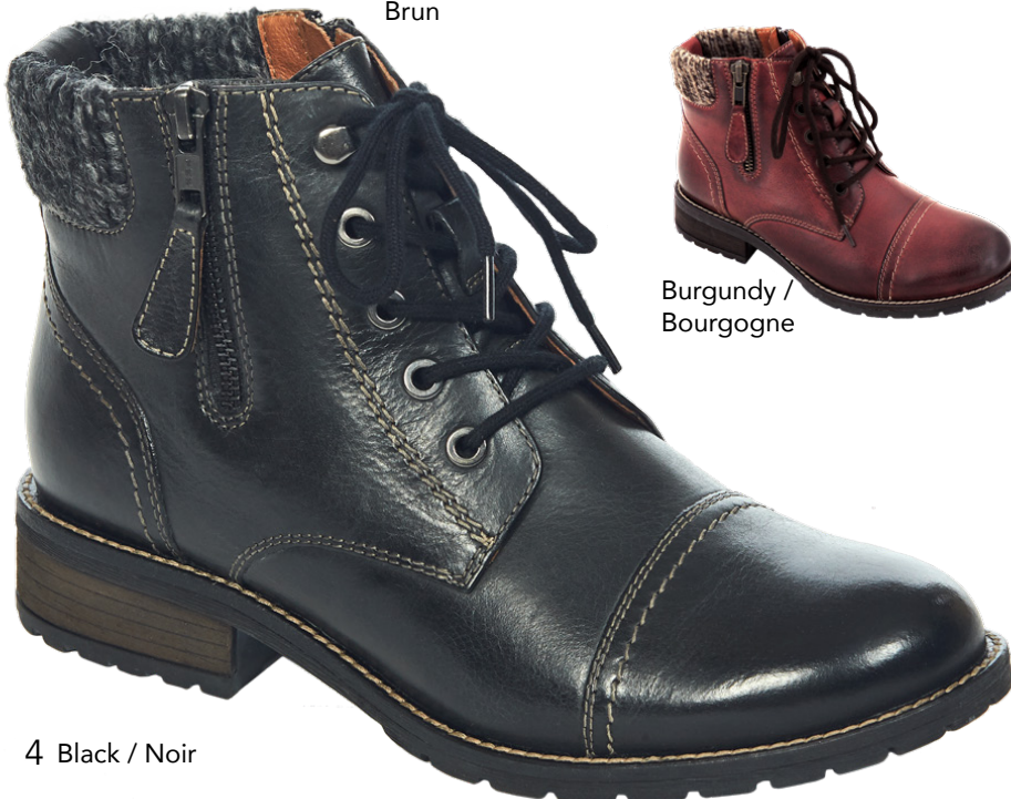
4 Black / Noir

Women's full sizes 36-42 Genuine leather upper Water repellent breathable membrane Synthetic wool lining Shaft height: 4.75" (12 cm) Heel height: 1.25" (3.2 cm) Inside & outside zipper Genuine leather full padded insole Lightweight & rugged TPR outsole