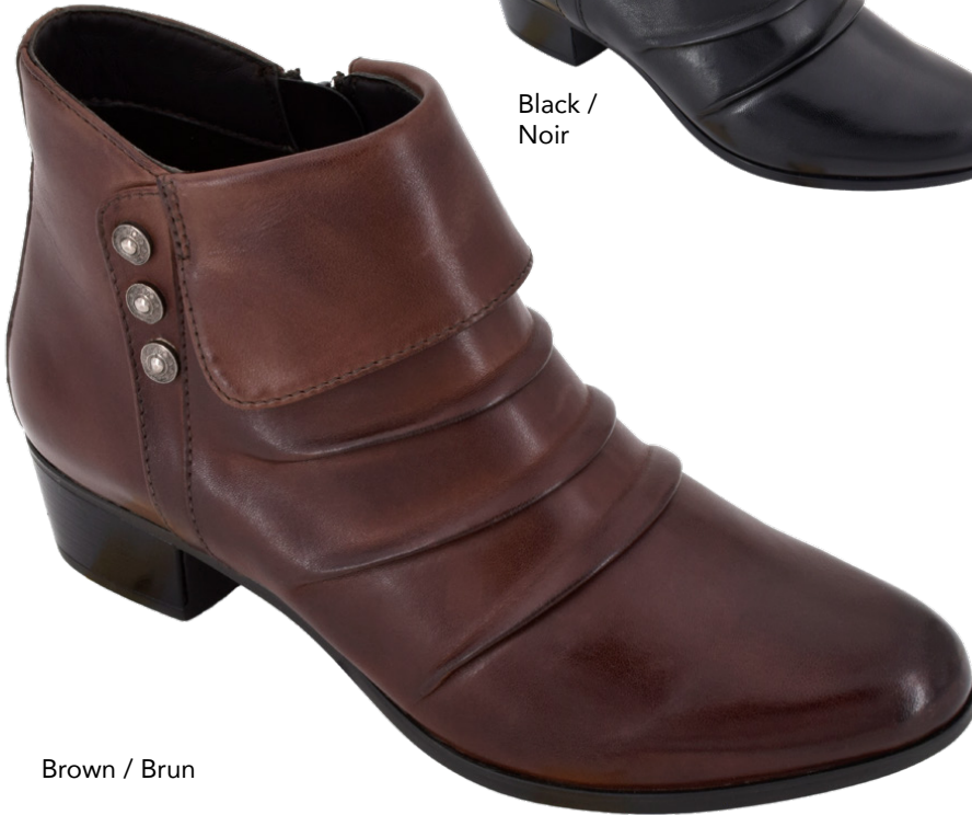
Brown / Brun

Women's full sizes 36-42 Genuine leather upper Water repellent breathable membrane Cozy brushed fleece lining Shaft height: 4" (10 cm) Heel height: 1.25" (3.2 cm) Inside zipper Genuine leather full padded insole Lightweight & durable TPR outsole