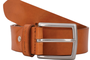
250415 - 35mm - Cognac/Cognac 250420 - 40mm - Cognac/Cognac