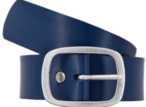
250477 - 35mm - Blue/Bleu