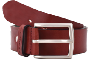
250416 - 35mm - Burgundy/Bourgogne 250421 - 40mm - Burgundy/Bourgogne