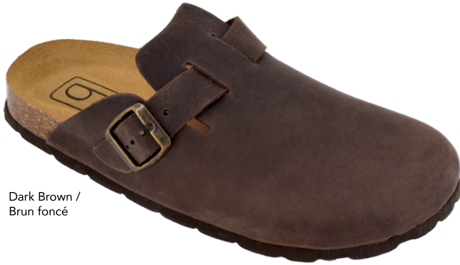
Dark Brown / Brun foncé