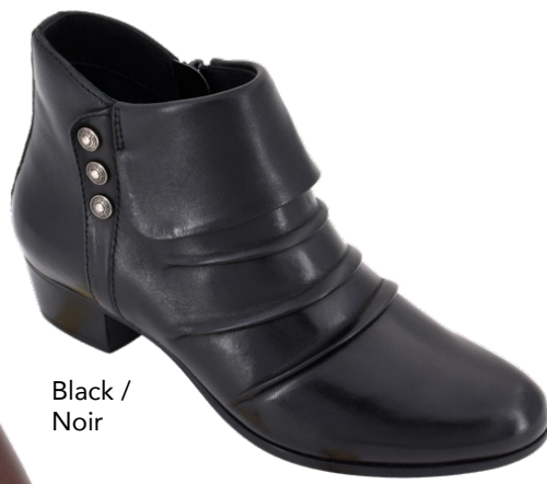
Black / Noir