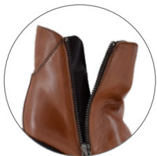
Inside & outside zipper Glissières intérieure et extérieure