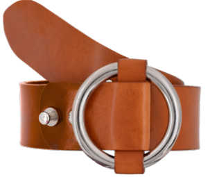
250471 - 35mm - Cognac/Cognac