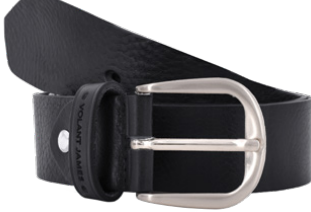
250426 - 40mm - Black/Noir