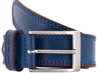
250483 - 35mm - Blue/Bleu