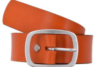
250476 - 35mm - Orange/Orange