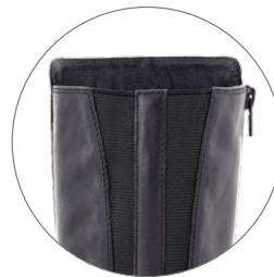
Easy on double gore Deux élastiques pour faciliter l'enfilage