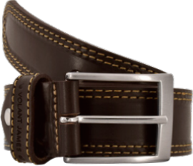
250481 - 35mm - Dark Brown/Brun Foncé