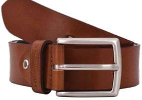
250414 - 35mm - Brown/Brun 250419 - 40mm - Brown/Brun