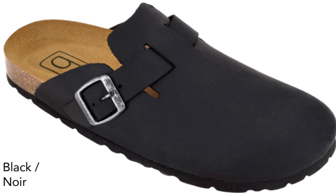
Black / Noir