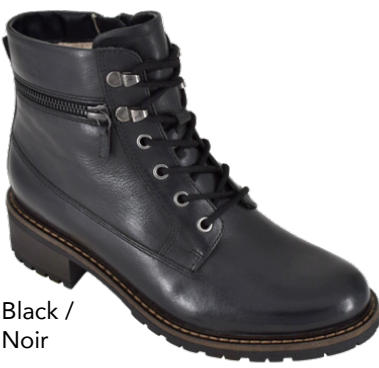
Black / Noir