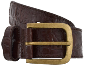
250479 - 35mm - Brown/Brun