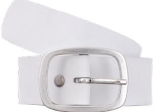
250473 - 35mm - White/Blanc