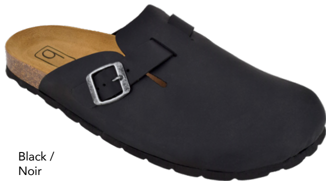
Black / Noir