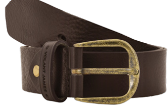
250427 - 40mm - Dark Brown/Brun foncé