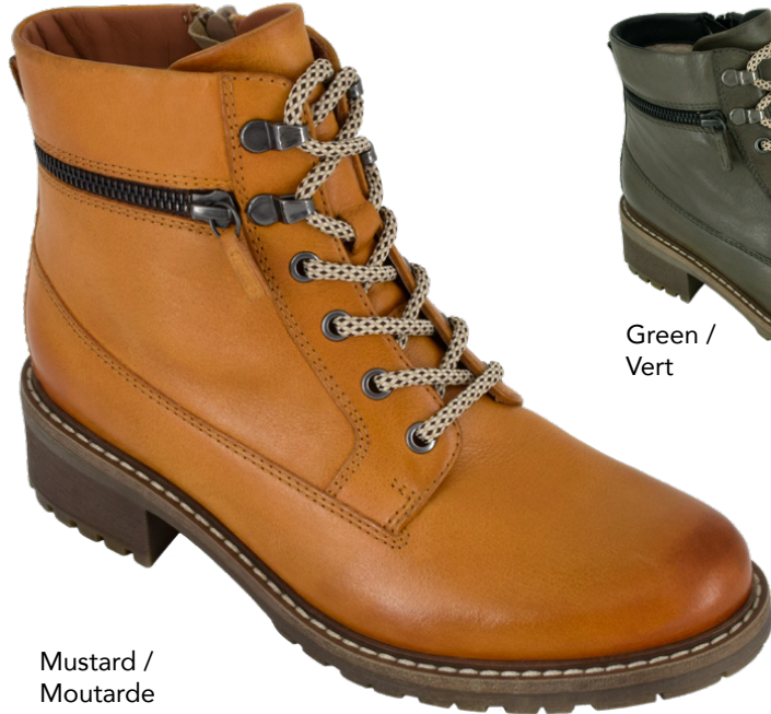
Mustard / Moutarde