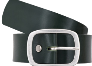
250475 - 35mm - Green/Vert