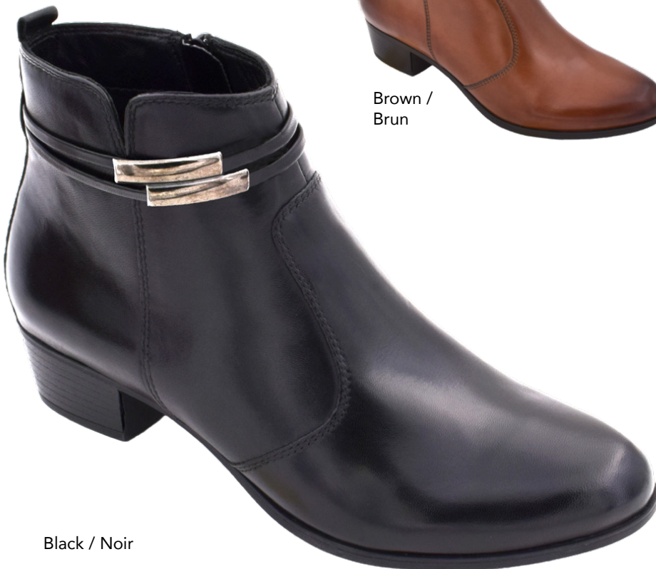
Black / Noir

Women's full sizes 36-42 Genuine embossed leather upper Water repellent breathable membrane Cozy brushed fleece lining Shaft height: 4" (10 cm) Heel height: 1.25" (3.2 cm) Inside zipper Genuine leather full padded insole Lightweight & durable TPR outsole