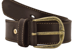
250423 - 35mm - Dark Brown/Brun foncé 250425 - 40mm - Dark Brown/Brun foncé