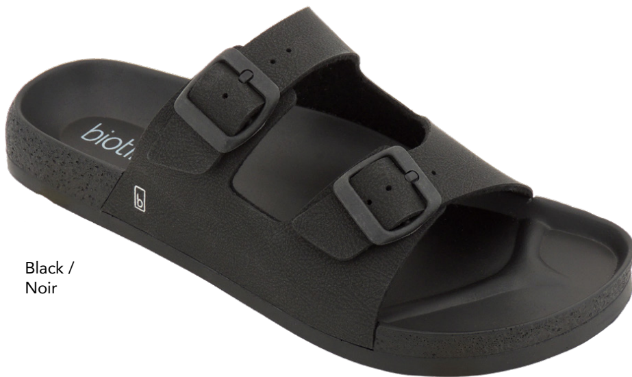
Black / Noir