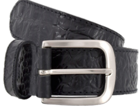
250478 - 35mm - Black/Noir