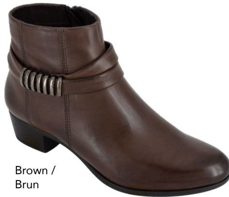
Brown / Brun