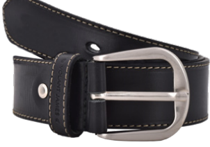
250422 - 35mm - Black/Noir 250424 - 40mm - Black/Noir