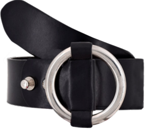
250468 - 35mm - Black/Noir