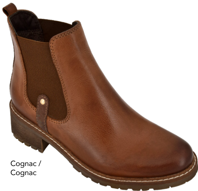
Cognac / Cognac