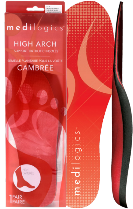
HIGH ARCH / VOÛTE CAMBRÉE