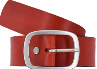
250474 - 35mm - Red/Rouge