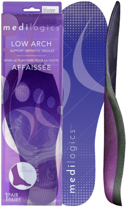
LOW ARCH / VOÛTE AFFAISSÉE

Medilogics® Arch Support Orthotic Insoles are engineered to offer optimal arch support for three natural arch types: low, neutral (medium) and high. Les semelles orthopédiques Medilogics® avec soutien de la voûte plantaire sont conçues pour offrir un soutien optimal pour trois types de voûtes : affaissée, neutre et cambrée.