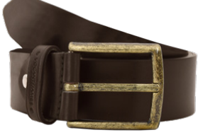
250413 - 35mm - Dark Brown/Brun foncé 250418 - 40mm - Dark Brown/Brun foncé