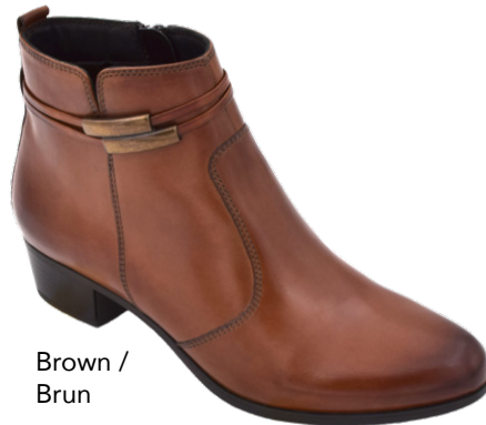
Brown / Brun