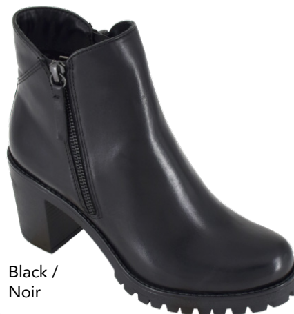
Black / Noir