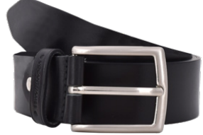
250412 - 35mm - Black/Noir 250417 - 40mm - Black/Noir