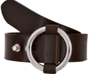
250469 - 35mm - Dark Brown/Brun Foncé