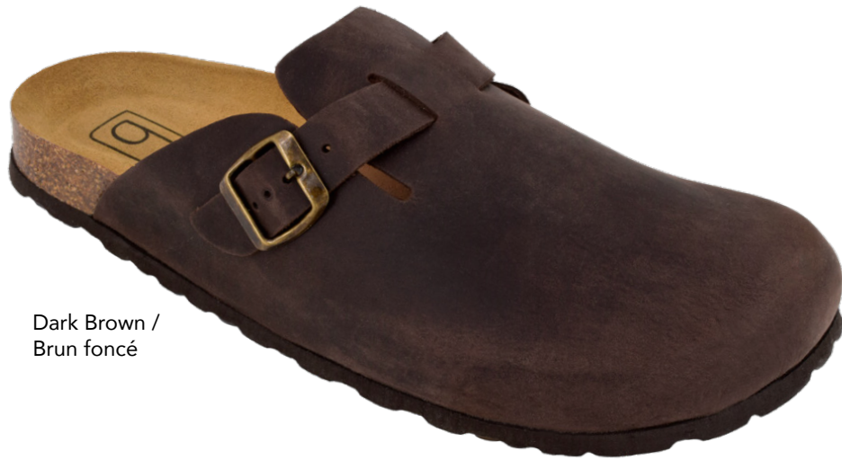
Dark Brown / Brun foncé