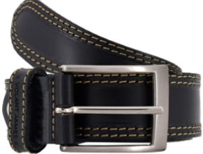
250480 - 35mm - Black/Noir