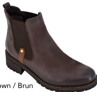
Brown / Brun

Women's full sizes 36-42 Genuine leather upper Water repellent breathable membrane Cozy brushed fleece lining Shaft height: 4.75" (12 cm) Heel height: 1.5" (3.8 cm) Easy on double gore Genuine leather full padded insole Lightweight & rugged TPR outsole