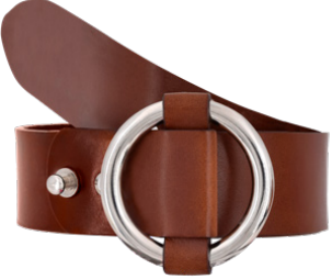
250470 - 35mm - Brown/Brun