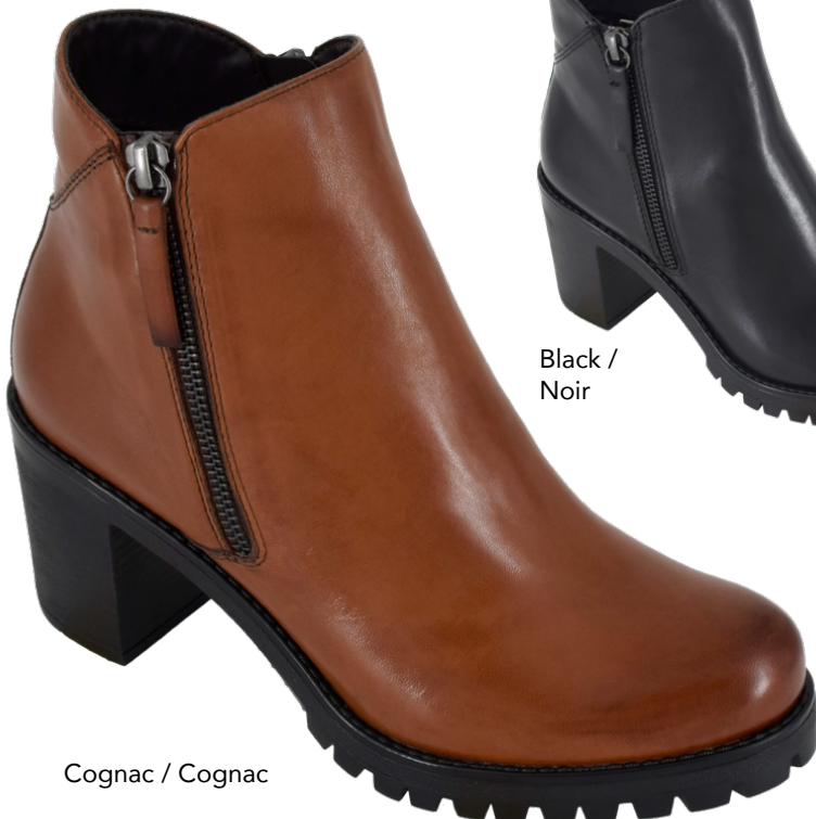
Cognac / Cognac