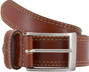
250482 - 35mm - Brown/Brun