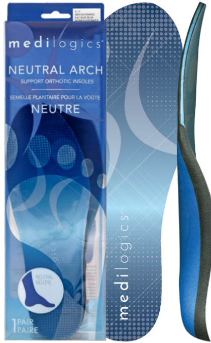
NEUTRAL ARCH / VOÛTE NEUTRE