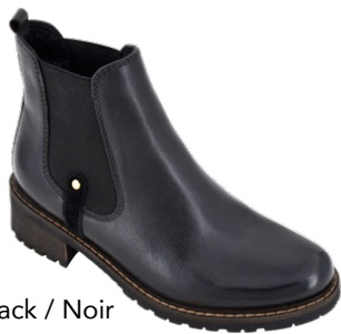
Black / Noir