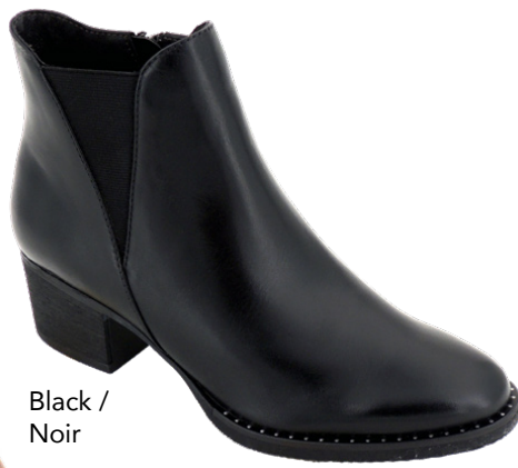
Black / Noir