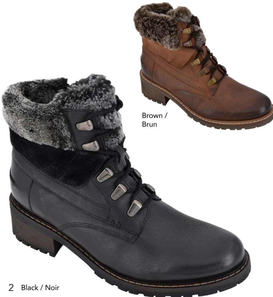
2 Black / Noir