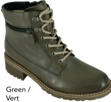
Green / Vert

Women's full sizes 36-42 Genuine leather upper Water repellent breathable membrane Synthetic wool lining Shaft height: 4.75" (12 cm) Heel height: 1.75" (4.4 cm) Inside zipper Genuine leather sock liner Lightweight & durable TPR outsole