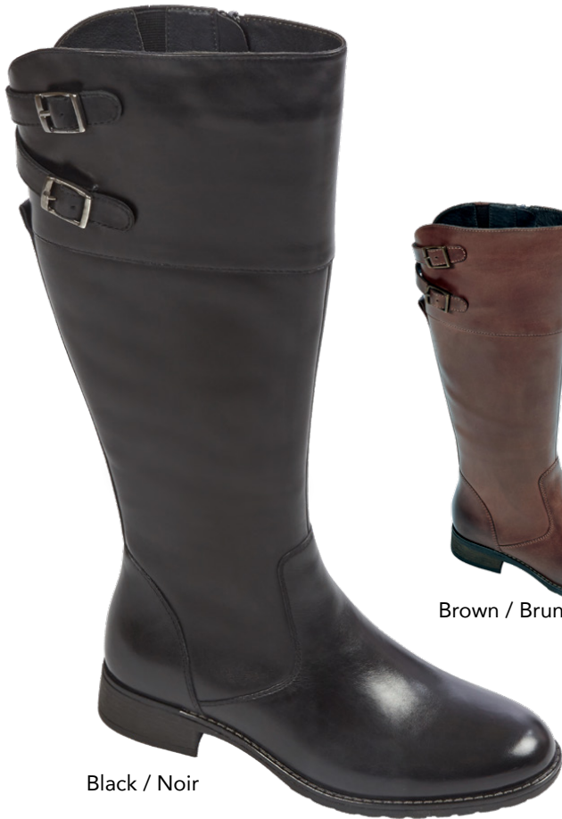
Black / Noir